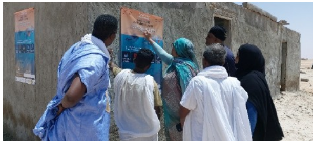
Affiche au village de Mamghar

Dès son arrivée au niveau de chaque village, l'équipe de l'ONG BiodiverCités en charge de la caravane de la mer, procède à l'affichage des cinq à six affiches dans différents endroits du village.