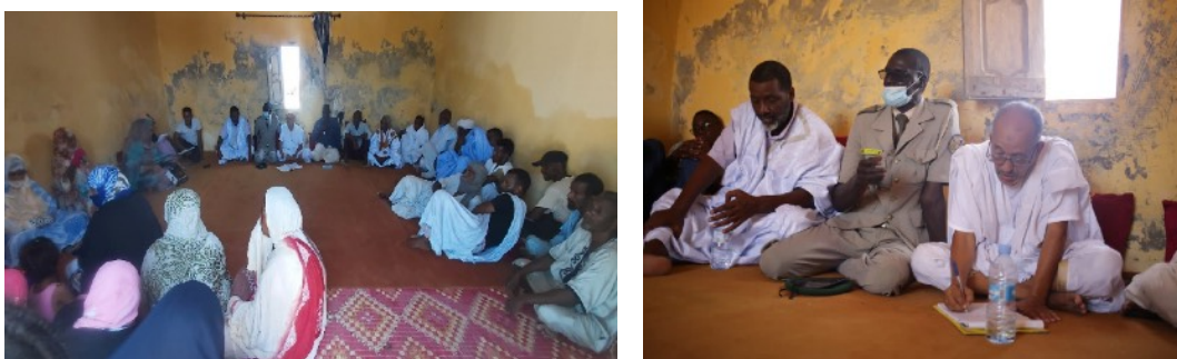
Réunion villageoise à Mamghar pour la désignation du comité de veille et d'alerte

L'implantation du comité local de veille et d'alerte environnementaux au niveau du village de Mamghar a été réalisée au cours d'une assemblée générale villageoise tenue chez le Chef de village.