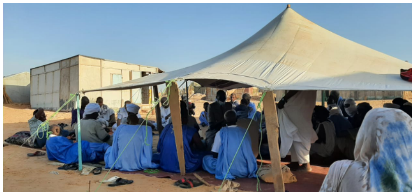
Réunion villageoise à R’Gueiba pour créer le comité de veille et d’alerte

L’implantation du comité local de veille et d’alerte environnementaux au niveau du village de R’Gueiba a été réalisé au cours d’une assemblée générale villageoise tenue chez le Chef de village.