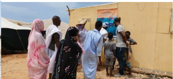
Affiche au village de R'Gueiba