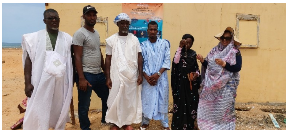
Membres du comité de veille et d’alerte environnementaux de R’Gueiba (avec la présidente de l’ONG Biodiversité)