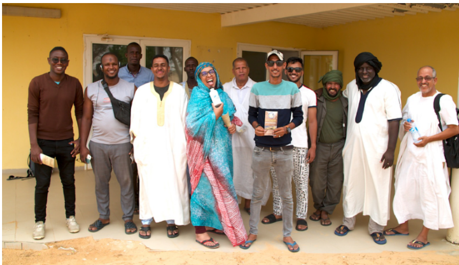
L'équipe de la caravane devant le centre d'interprétation environnemental de Chami

ONG BiodiverCités – Siège Social : Nouakchott – République Islamique de Mauritanie B.P. 4830 – Tel +222 36 31 76 15 - web : www.biodivercites.co – courriel : mabdallahi@yahoo.fr