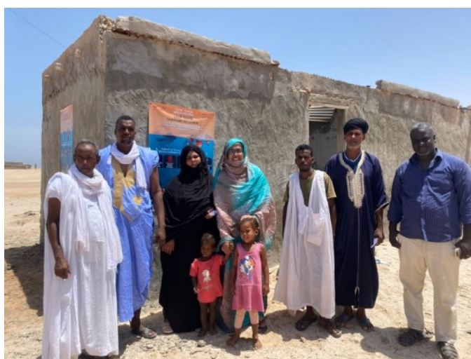
Membres du comité de veille et d'alerte de Mamghar