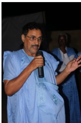
Mot de bienvenue du Maire de Mamghar

Après la projection, l'équipe anime des séances de débats et répond aux questions posées par le public.