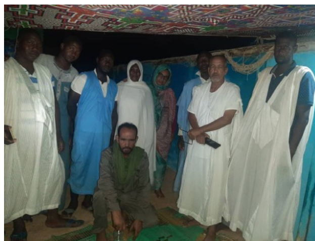
Membres du comité de veille et d'alerte d'Iwik (avec des éléments du PNBA)