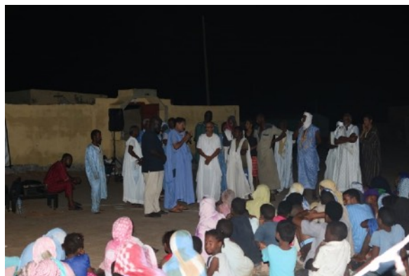
Débats et questions-réponses après la projection de films à Mamghar